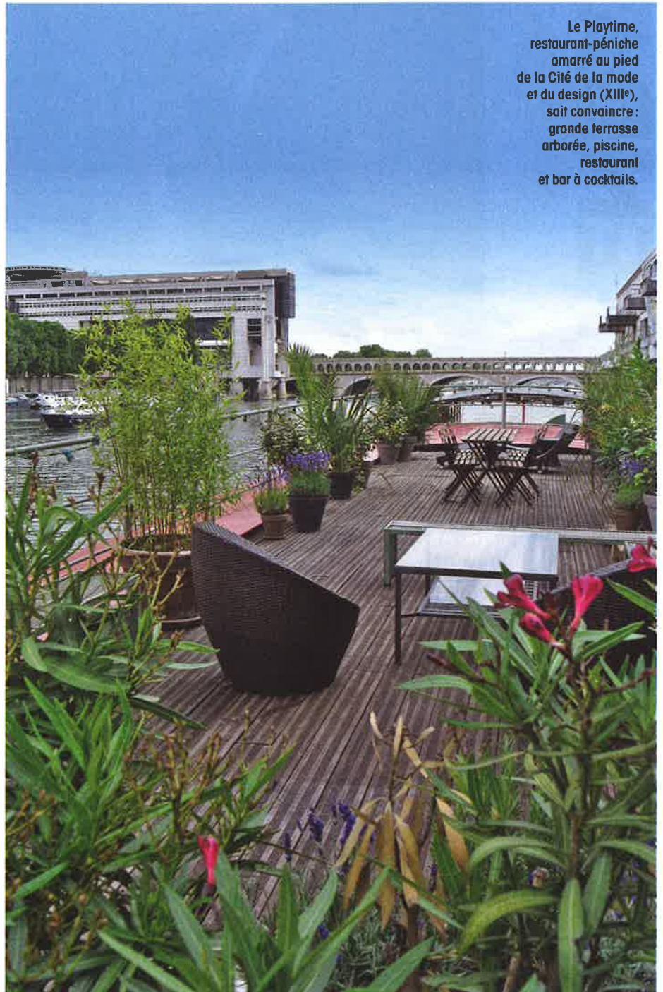
Le Playtime, restaurant-péniche amarré au pied de la Cité de la mode et du design (XIII e ), sait convaincre : grande terrasse arborée, piscine, restaurant et bar à cocktails.